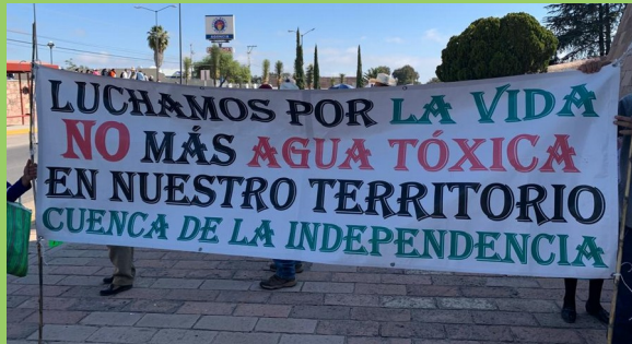
(Manifestación contra el Proyecto Cerro del Gallo)

En julio de 2021, hubo preocupación cuando la empresa envió algunos directivos a reunirse con el gobernador del estado, Diego Sinhue Rodríguez Vallejo. 70 El Gobernador, a pesar de no tener facultades para otorgar permisos mineros, ha generado presión sobre el municipio de Dolores Hidalgo, quien sostenía un compromiso verbal con el movimiento movilizado en defensa de la Cuenca de la Independencia para no entregar ningún tipo de permiso para la mina.