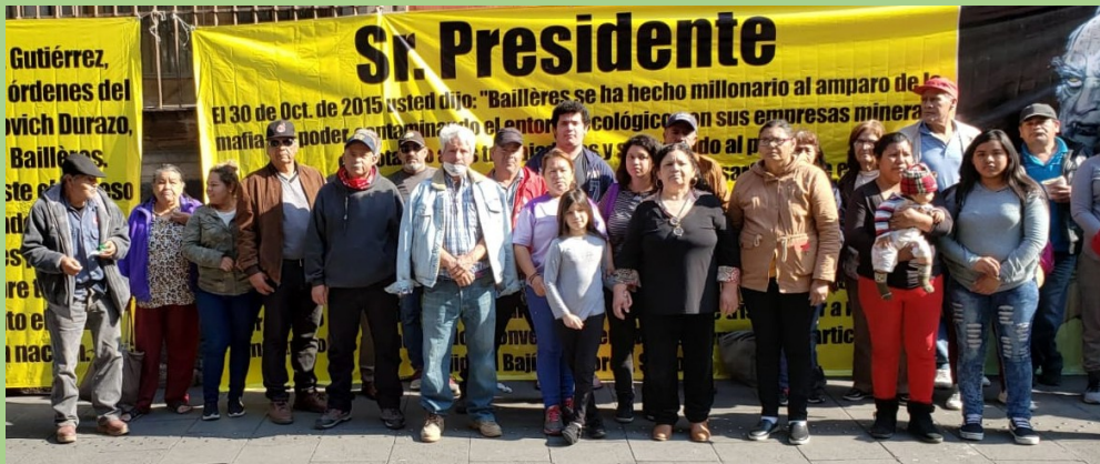
(Detenciones de ejidatarios 2016 y protesta en la CDMX)

Mientras todos quedaban en casa para evitar la cadena de contagios, la actividad minera y el crimen organizado actuó en contubernio con las autoridades para amedrentar a las y los ejidatarios. Este caso sigue impune, como tantos otros asesinatos de defensores y defensoras en México. El estado tampoco ha proporcionado alguna protección a los familiares, aunque sí provee constantes rondines de la policía estatal, la Guardia Nacional y el ejército, para intimidar a la población. La única vigilancia con la que cuentan es aquella que envía el gobierno y las empresas para sembrar terror psicológico y actuar impunemente contra la comunidad.