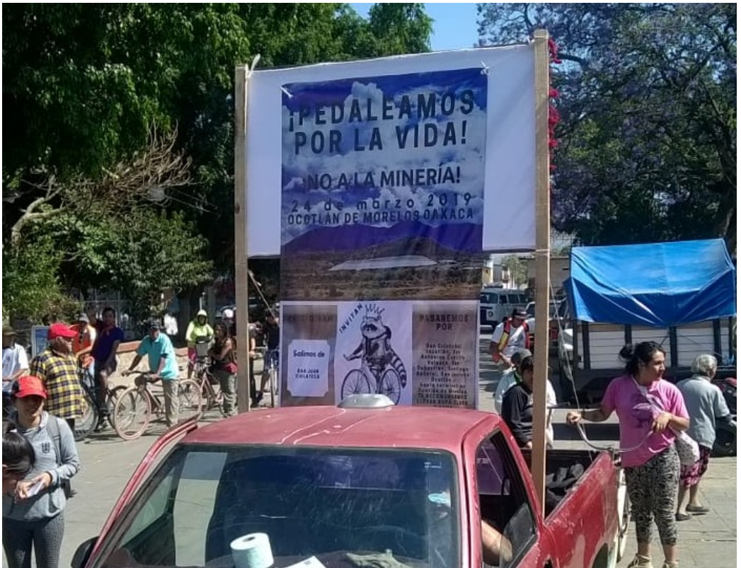
(Articulación por la Vida contra la Minera del Valle de Ocotlán)

está en quinto lugar en el mundo por muertes confirmadas por COVID-19 y en cuarto lugar por la mortalidad de esta enfermedad, un porcentaje que se calcula dividiendo el total de difuntos por casos de COVID-19 confirmados. 11