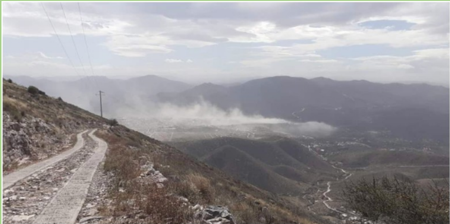
(Contaminación del aire por la mina en Zimapán)

Esta y otra presa de la minera La Purísima hacen descargas que van al arroyo y que han provocado que la producción agrícola de las huertas aguas abajo se haya visto mermada.