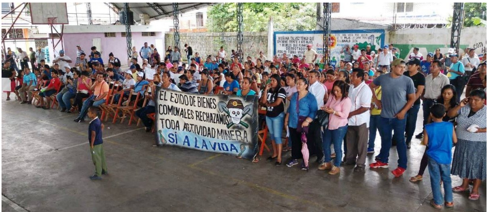
(Acacoyagua, Chiapas, Municipio Libre de Minería)

En México pudieron contar con el gobierno que siguió el guión impuesto por los Estados Unidos y el marco del Tratado de Libre Comercio para acceder a sus demandas, categorizando como “esencial” la muerte segura garantizada por los proyectos mineros, sin importar o cuestionar los impactos en las vidas de las poblaciones afectadas. Las empresas mineras contaban con toda la protección de las fuerzas del estado, y hasta nuevas, entre ellas la flamante Policía Minera y el enorme despliegue de la Guardia Nacional. Mientras, las comunidades cuentan con más y más inseguridad ante la ola de violencia a la par de los contagios, secuelas y muertes por COVID-19.