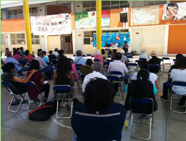
( Articulación por la Vida contra la Minería del Valle de Ocotlán )

Durante la pandemia, sus esfuerzos se dirigieron hacia la Secretaría de Medio Ambiente y Recursos Naturales (SEMARNAT) para exigir una revisión de lo ocurrido con el derrame e implementar un proceso de remediación. Sin embargo, la propia SEMARNAT ha dilatado el proceso, administrando el conflicto sin avances significativos. En este proceso, el “ quédate en casa ” resultó contraproducente para las resistencias ya que la empresa continuó operando mientras las oficinas del gobierno pararon, contribuyendo al estancamiento de procesos durante prácticamente un año.