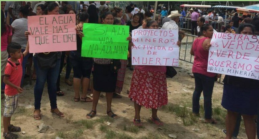
(Marcha en Acacoyagua contra la minería)

Con la ayuda del gobierno de Chiapas, las empresas citaron a las comunidades con el pretexto de “reanudar el diálogo”, convocando a dieciséis líderes comunitarios que las empresas en el 2017 habían criminalizado y deslegitimado.