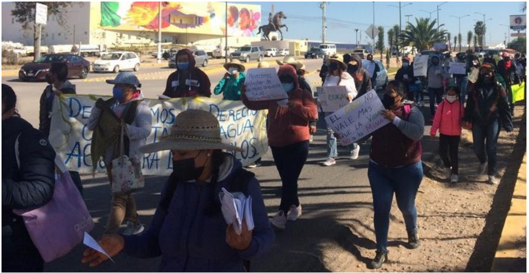
(Manifestación contra el Proyecto Cerro del Gallo, Guanajuato)

servicios de salud que realizaron, CAMIMEX declaró que “la minería continúa siendo un pilar para el desarrollo económico de México y hoy más que nunca, fundamental para la reactivación económica tan necesaria para el país.” 37