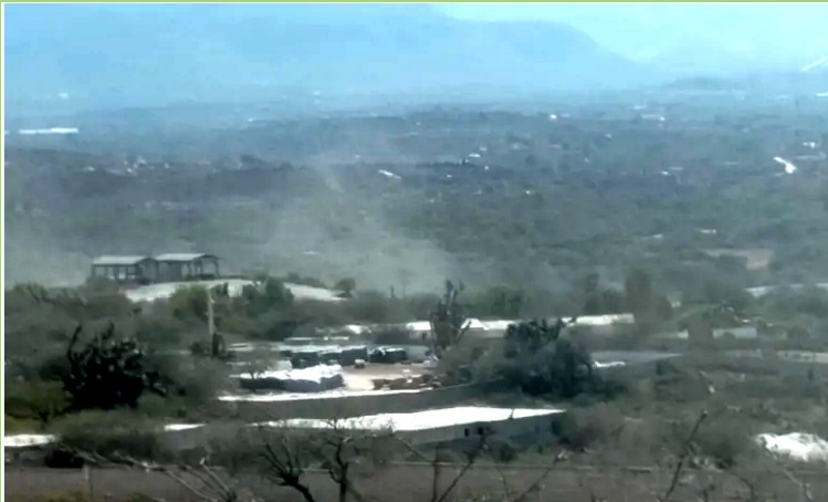
(Jales mineros, Hidalgo)

Las empresas logran operar con impunidad dada la estrecha relación con el gobierno y la falta de respuesta efectiva de las autoridades ambientales, con la excusa de que la Procuraduría Federal de Protección al Ambiente (PROFEPA) no tiene un titular en el estado desde 2019.