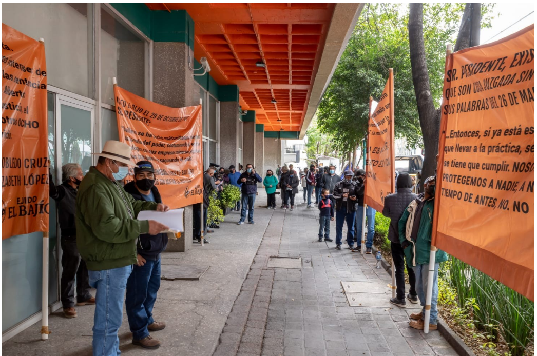
(Protesta El Bajío en la Ciudad de México)

que nunca el trabajo en defensa del territorio y la naturaleza, las medidas de contingencia decididas por los gobiernos privilegiaron a las grandes empresas, logrando obstaculizar estos esfuerzos comunitarios tan necesarios para la salud, la alimentación y el medio ambiente. El encierro, la generación de miedo a enfermarse y la imposición del distanciamiento social, medidas impulsadas para prevenir los contagios a través de la campaña de la “Sana distancia” y “Quédate en casa”, generaron condiciones aun más asimétricas para defender la salud comunitaria y el territorio, mientras las empresas continuaban operando.